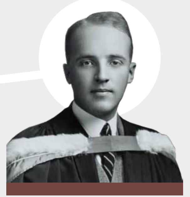
Charles H Best