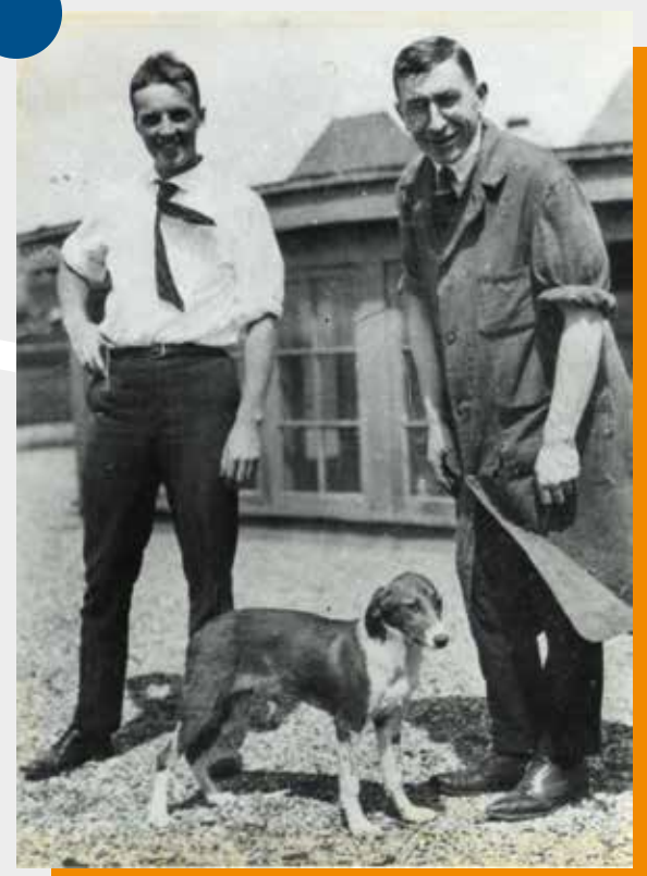
Best et Banting