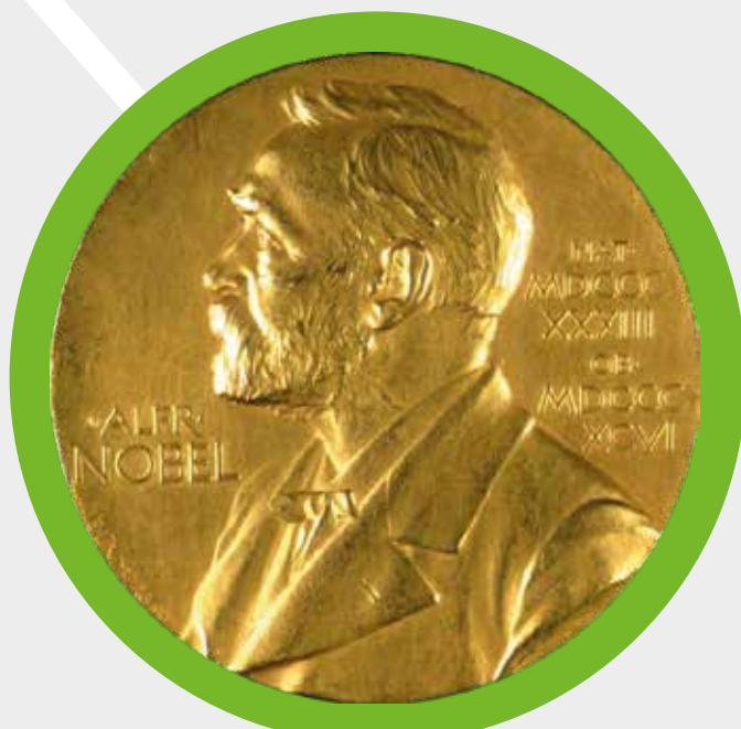
Le prix Nobel