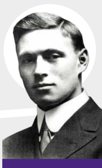
James B Collip