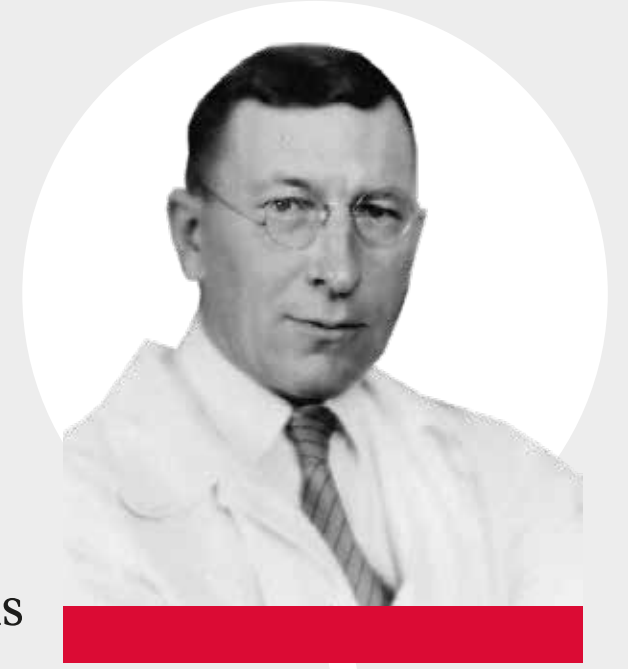
Frederick G Banting